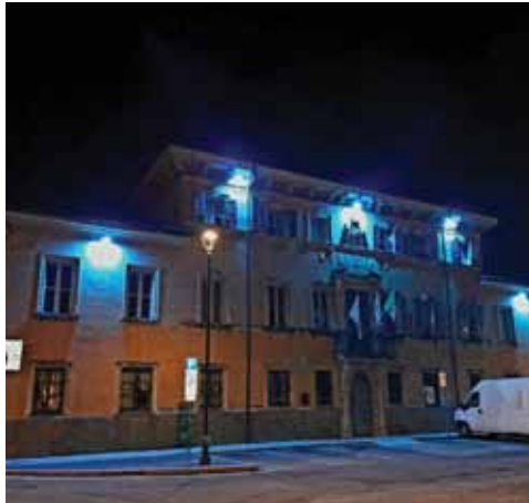
San Martino B.A.

Numerose amministrazioni comunali - tra cui quelle di Villafranca di Verona, Soave, Bussolengo, Boschi Sant'Anna, Cologna Veneta, Sanguinetto, San Martino Buon Albergo , Ronco