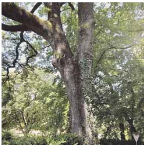
Valeggio sul Mincio, Farnia all'interno del Parco Sigurtà

monumentale, ricorda anche l'importante ruolo storico ed economico dell'Alta Lessinia, simboleggiato dal tratto di strada tra Bosco Chiesanuova e Lugo di Grezzana. Costruito nel 1777 per trasportare il legname verso la zona della Bassa Lessinia, a San Martino Buon Albergo in località Brolo Camozzini, si trova un