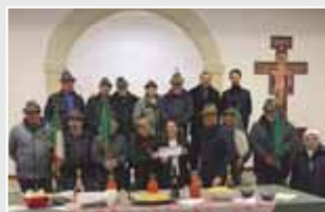
6070287); l'ultimo incontro sarà sabato 9 dicembre alla baia di Santa Maria (prenotazioni entro il 6 dicembre in baia o al numero 348 0484398). Il costo per la cena è di 20 euro e gli utili saranno devoluti alla Caritas per far fronte alle esigenze delle famiglie e dei compaesani che versano in condizioni di difficoltà. L'anno scorso avevano partecipato più di duecento persone e il ricavato donato in beneficenza aveva raggiunto i 2500 euro (nella foto la consegna dell'assegno del ricavato dello scorso anno).