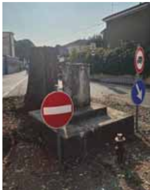
Quel che rimane dell'olmo e della croce secolari a Santa Maria di Zevio