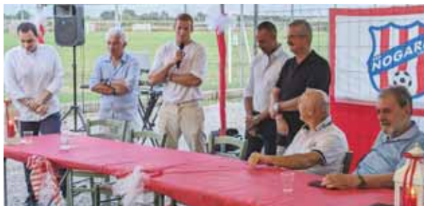
Federico Baschirotto al raduno della prima squadra del Nogara Calcio

Obiettivo creare nuovi Baschirotto. L'Ssd Nogara Calcio ha inaugurato la stagione sportiva con il raduno della prima squadra e accogliendo il proprio figlio prediletto: Federico Baschirotto , 26 anni, ha completato tutta la trafila nelle giovanili del Nogara fino ad arrivare alla serie A con la maglia del Lecce e alla convocazione in nazionale. Una gavetta vera, dura e ricca di sacrifici quella di Baschirotto, toccando tutte le serie a partire dalla Promozione con il suo Nogara. In seguito Legnago, Forlì, Viterbese e Ascoli tra le tappe più significative. Sempre più su, migliorando in maniera costante anno dopo anno e coronando molti dei suoi sogni da bambino. «E' il sogno di ogni giovane che inizia a giocare a calcio - ha confermato Baschirotto durante la presentazione -. Riuscire a giocare in serie A ed essere convocati in nazionale sono obiettivi che richiedono grande determinazione. Per me è un