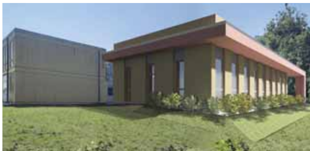
Sopra, ecco come sarà la nuova struttura i cui lavori inizieranno a settembre

Sarà realizzata alle scuole Collodi: l'opera costerà 965mila euro, 809mila dal contributo del Pnrr ottenuto dal Comune